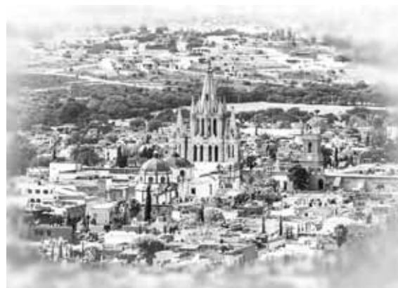
歴史ある美しい街

ることでも知られており、彼の名がそのまま街の名となりました。生家は歴史博物館として見学が可能です。また、メキシコ全土に知られたアジェンテ美術学校やエルニグロマンテ文化会館があり、芸術家が集まるアートの街という側面もあります。街の魅力は海外の旅行雑誌「Travel+Leisure」で2017年と2018年に「旅行者が選ぶ世界の街ランキング」で一位になったことでも証明されています。