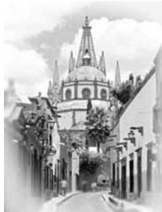
ぶらぶら歩くだけでも楽しい