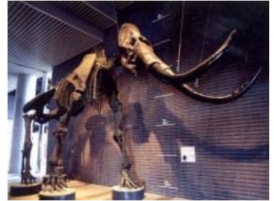
▲ミュージアムパーク 茨城県自然博物館